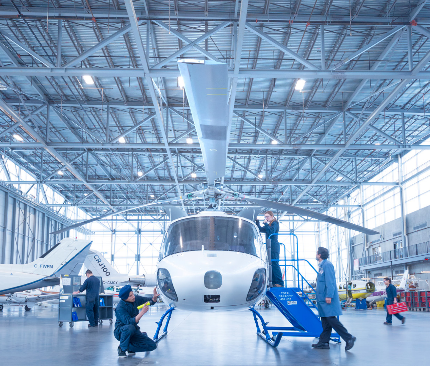
Estudiantes de mantenimiento de aeronaves en el Campus de Tecnología Aeroespacial del BCIT.