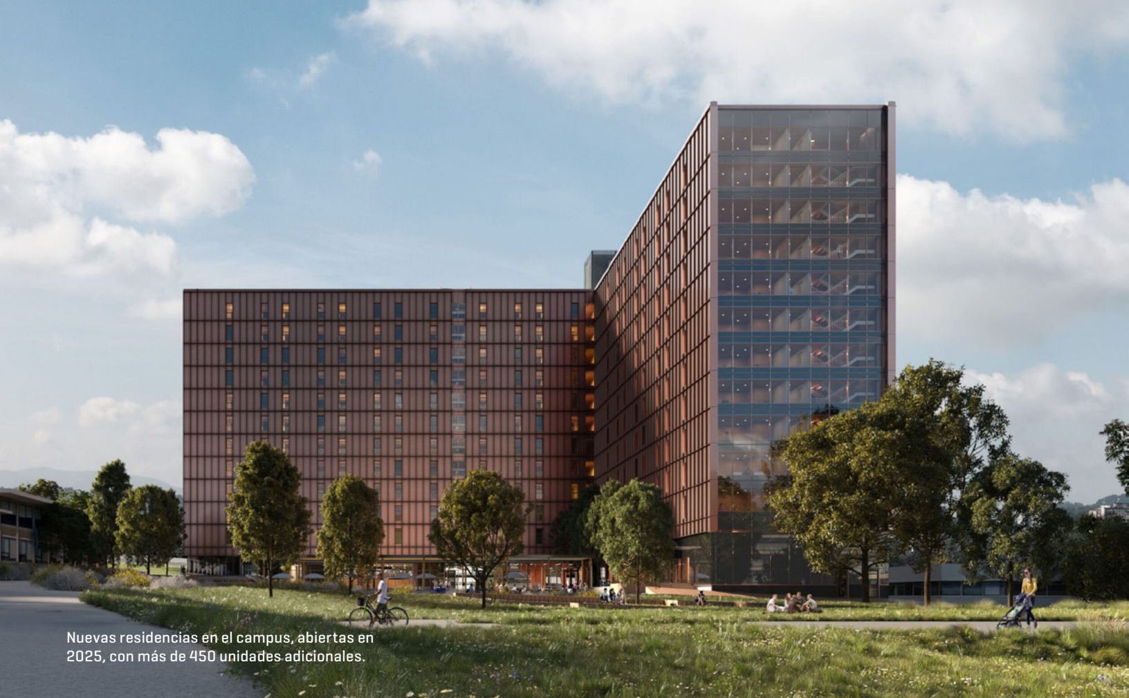
Nuevas residencias en el campus, abiertas en 2025, con más de 450 unidades adicionales.